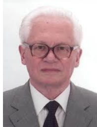
Матвеев В.В. д.ф.-м.н., професор акад. НАН України