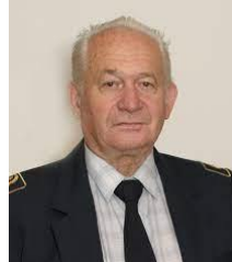
Надутий В.П. д.т.н., професор