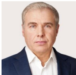
Калетнік Г.М. д. е. н., професор академік НААН України