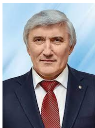
Адамчук В.В. д.т.н., професор акад. НААН України